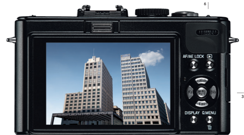
Illustration à l'échelle 1/1