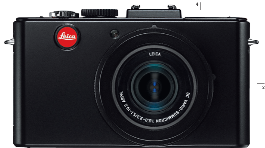
Illustration à l'échelle 1/1