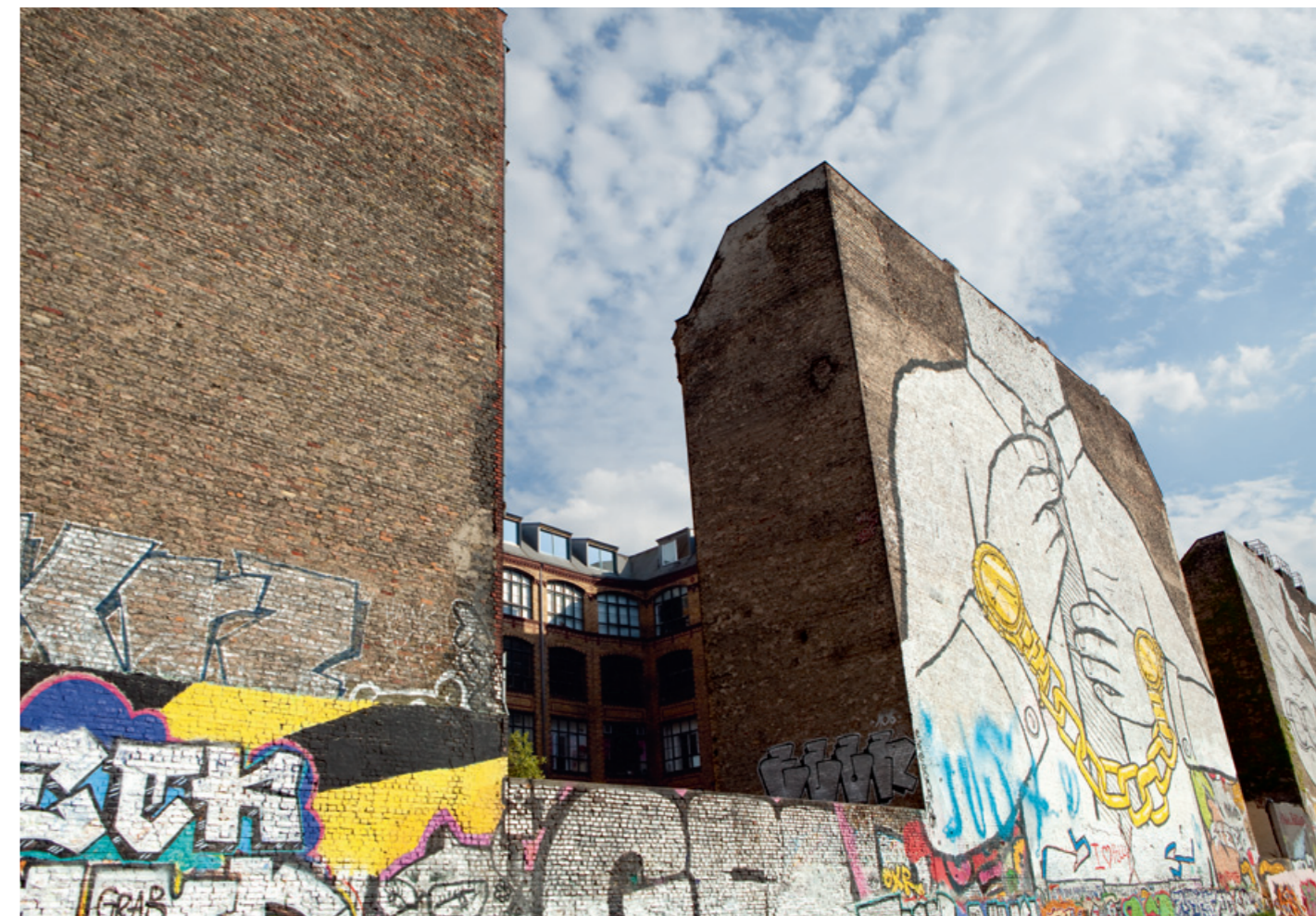
En haut : Au printemps 2010, quatre artistes affiliés au street art de renommée internationale ont relooké le « Bierpinsel » de Steglitz à la demande de la nouvelle propriétaire. En bas : Grâce à ses nombreuses façades vierges, Berlin est depuis longtemps pour les artistes du street art la ville des possibilités infinies. De nombreux artistes ont lancé leur carrière internationale dans la capitale allemande.