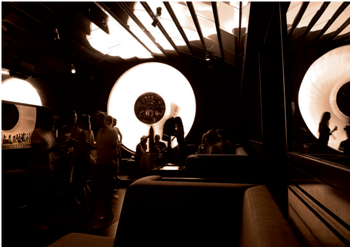
Berlin, New York, Londres, Tokyo ! Avec son design intérieur mondain dans le style club des années 80, le Bar Tausend est l'incarnation même du chic party international. L'installation lumineuse « Das Auge » du lampiste berlinois Schneider-Moll à l'extrémité du local décorait autrefois les espaces de vente de Louis Vuitton à Paris.