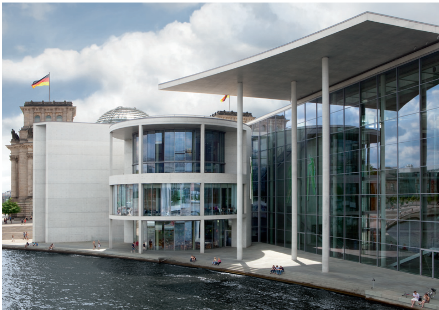
Cela n'existe qu'à Berlin : des transats et une ambiance balnéaire au cœur du quartier gouvernemental.

Berlin est unique à bien des points de vue – ainsi avec la chute du mur est né le plus grand « champ expérimental » d'architecture moderne qu'il y ait jamais eu dans une capitale européenne dans une période récente. À commencer par la place de Postdam réaménagée et le nouveau quartier du gouvernement qui s'étend au nord du Reichstag. Le plan d'urbanisme des architectes berlinois Schultes et Frank est considéré comme un coup de génie. Mais à Berlin, c'est de tradition : la Nouvelle Galerie nationale, édifiée de 1965 à 1968 selon les plans de l'ancien directeur du Bauhaus Mies van der Rohe, est considérée jusqu'à ce jour comme l'icône du moderne classique.