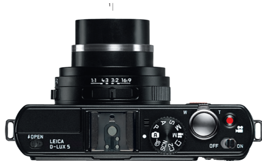
Illustration à l'échelle 1/1

Espace de créativité pour des moments d'inspiration.